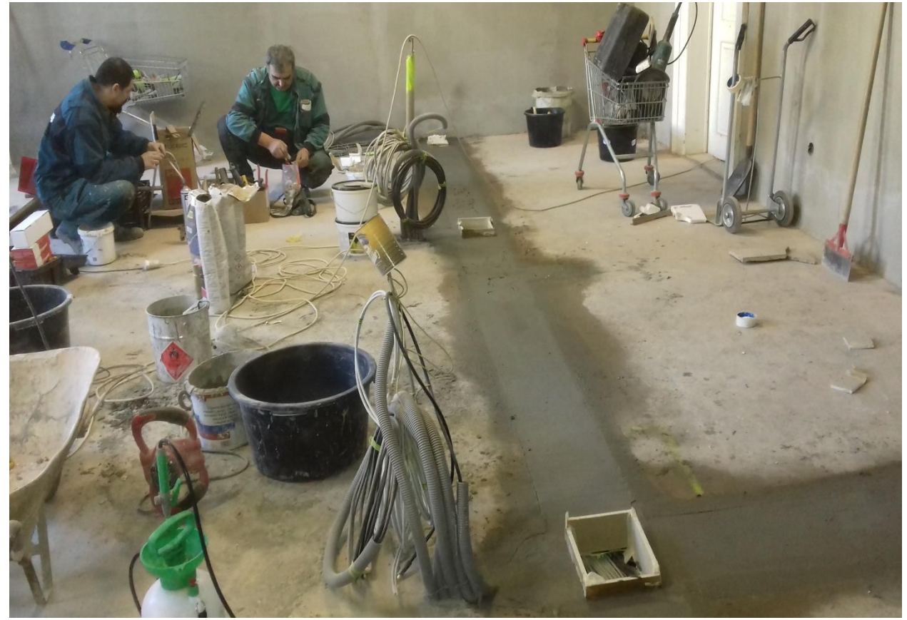
Pokládka rozvodov 230V a IT infraštruktúry do podlahy