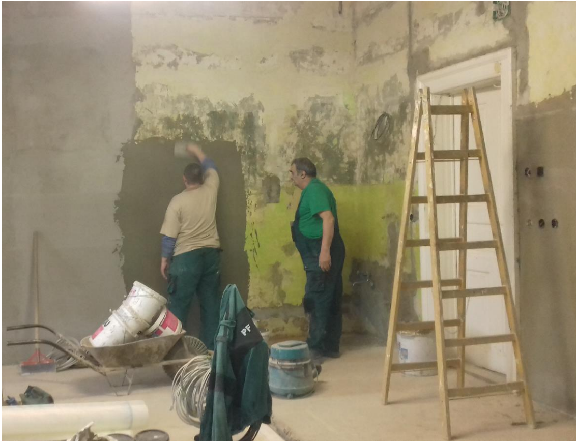
Realizácia nových omietok MVR

UPIŠ – Stavebné rekonštrukcie 2020 Spracoval : František Liško