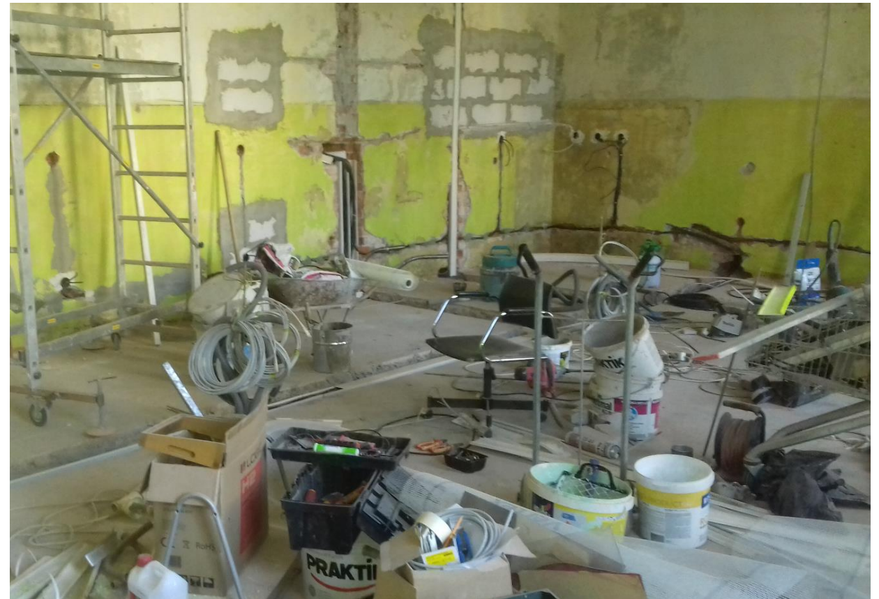
Zamurovanie otvorov po demontáži starých rozvádzačov.