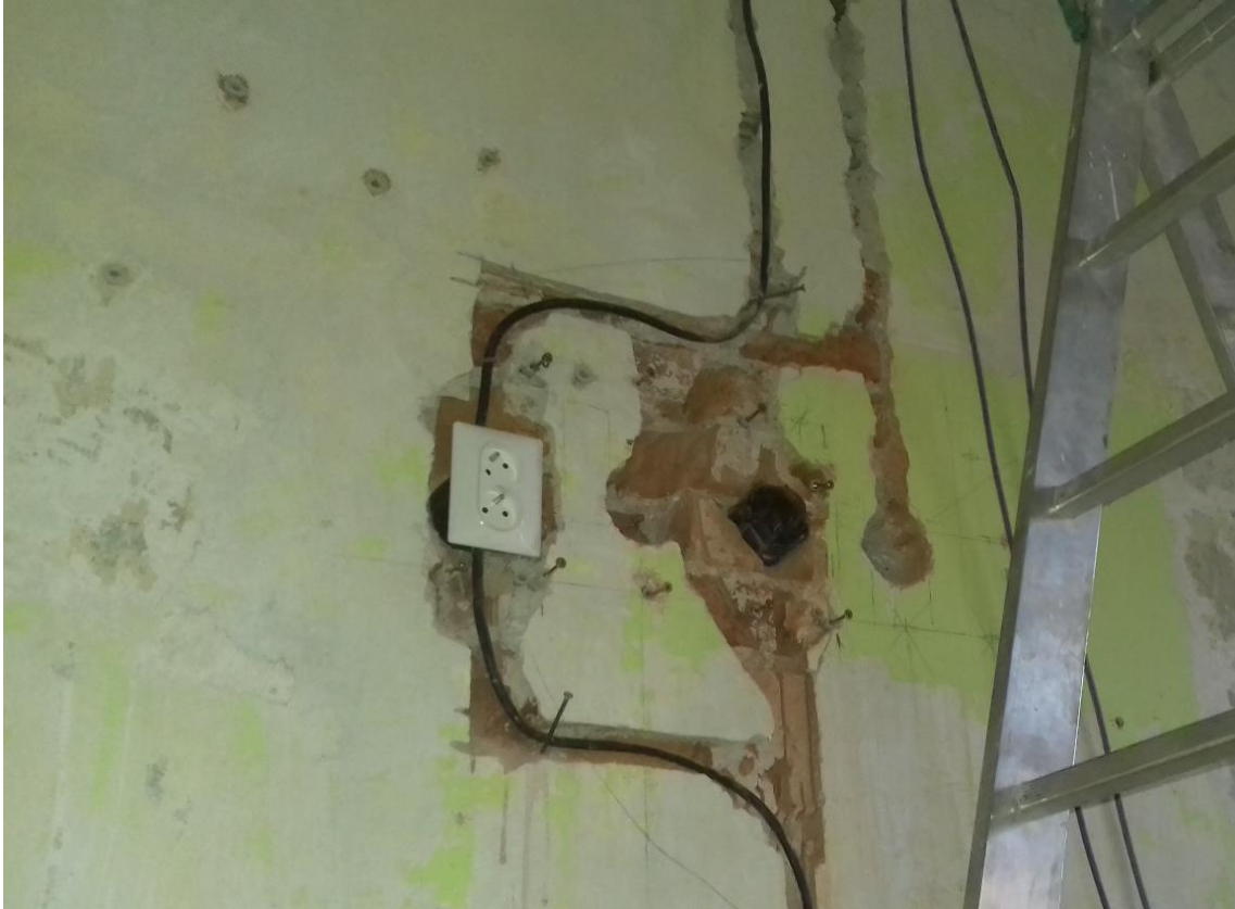
Príprava napájania interaktívnej tabule

UPIŠ – Stavebné rekonštrukcie 2020 Spracoval : František Liško