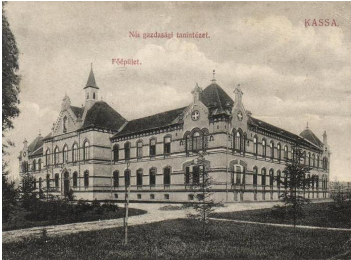
Archívny záber pôvodného stavu budovy

UPIŠ – Stavebné rekonštrukcie 2020 Spracoval : František Liško