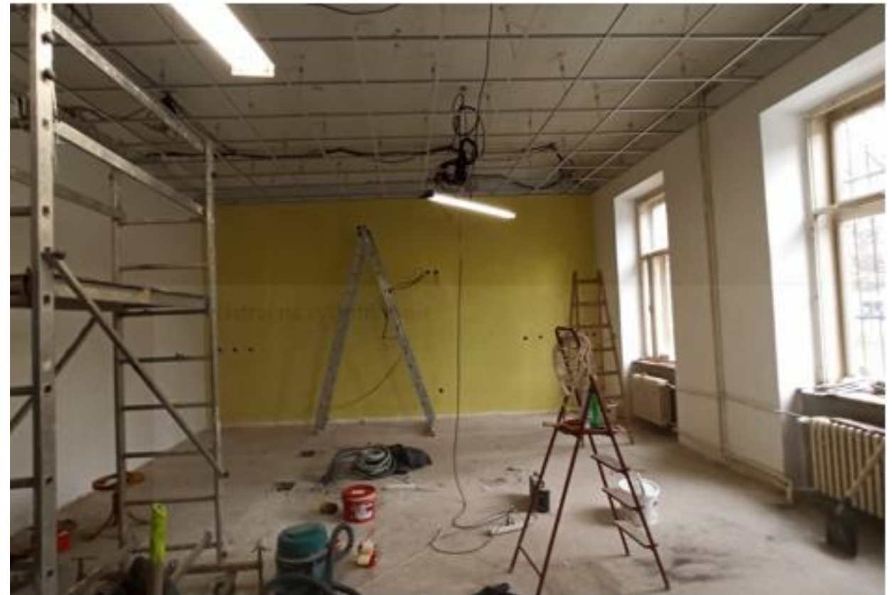
Raster zníženého stropu