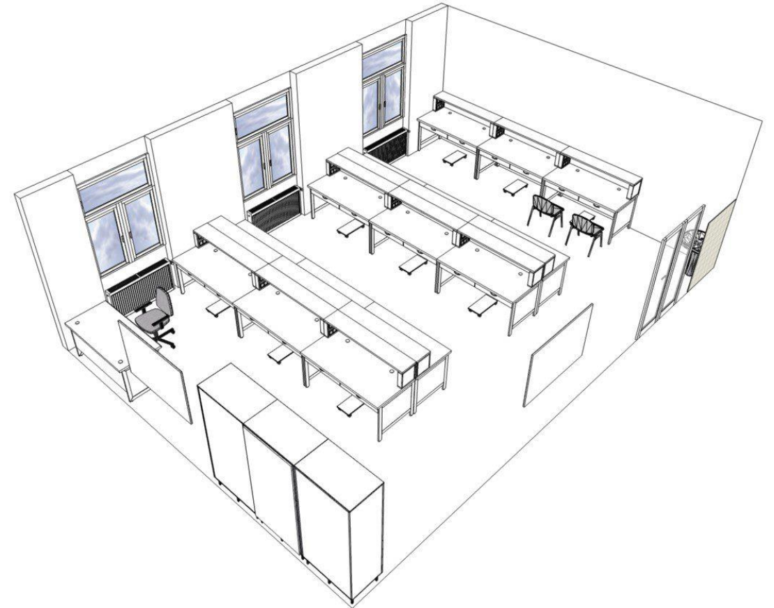
Projektová štúdia laboratória.